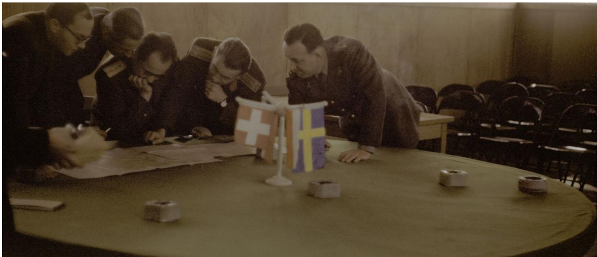
Pravidelné setkání československých, polských, švédských a švýcarských členů DKNS v polovině 50. let

Vzhledem k faktu, že v roce 1959 (jedenáct let po vyhlášení nezávislosti KR a KLDK) tak z více než 80 členských zemí OSN jich pouhých 28 (poměr byl lehce ve prospěch KLDK 15:13) navázalo diplomatické styky s jedním či druhým korejským státem, bylo jasné, že svět vyčkával, zda nakonec nedojde k plánovanému sjednocení obou Korejí v jeden stát. A to přesto, že korejská válka (1950-53) dala jasně najevo, že vznik jediného korejského státu není otázkou krátké doby. Proto ty země, které se rozhodly navazovat diplomatické styky s jednou či druhou Korejí, byly vždy jen ty, které měly výrazný politický zájem na jedné či druhé straně poloostrova. Bývalé Československu se po převzetí moci komunisty v únoru 1948 orientovalo výhradně na spolupráci zemí tzv. „Sovětského bloku“, takže proamericky orientovaná Korejská republika pro něj nebyla ani teoretickým partnerem, logicky se tak stalo jedním ze zastánců a partnerů Korejské lidově demokratické republiky na severu Korejského poloostrova.