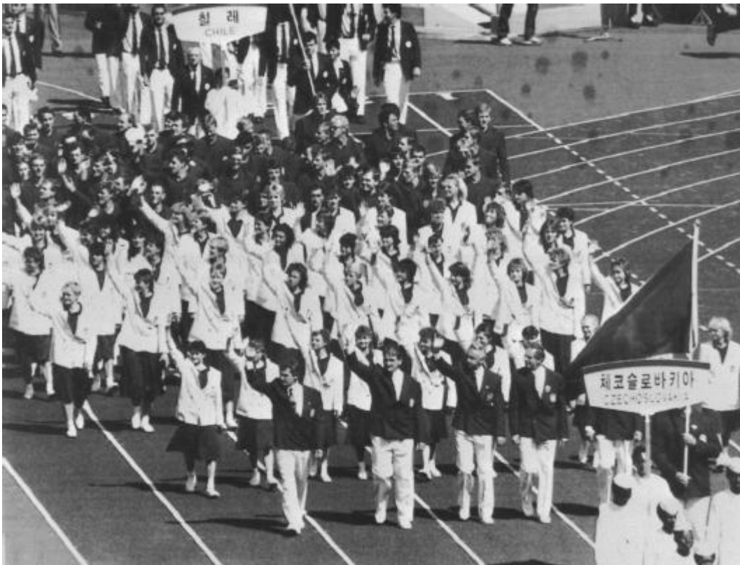
československá delegace pochoduje při zahájení OH 1988 v Soulu

K náznaku změny došlo až ve chvíli, kdy nejprve Sovětský svaz začal v 70. letech s Korejskou republikou občasně komunikovat, a navíc se začalo výrazně zlepšovat ekonomické postavení Korejské republiky. Velký význam pro vzájemné se otevření mělo i rozhodnutí Mezinárodního olympijského výboru přidělit Soulu konání Olympijských her v roce 1988. Země socialistického bloku – přes nátlak KLDK – už nebyly ochotny pokračovat v sérii olympijských bojkotů (v Montrealu 1976 chyběly země Afriky, v Moskvě 1980 většina západních zemí, zatímco v Los Angeles 1984 zase drtivá většina zemí socialistického bloku), kontakty s představiteli Korejské republiky tak byly navázány – byť zpočátku jen na obchodním a sportovním poli.