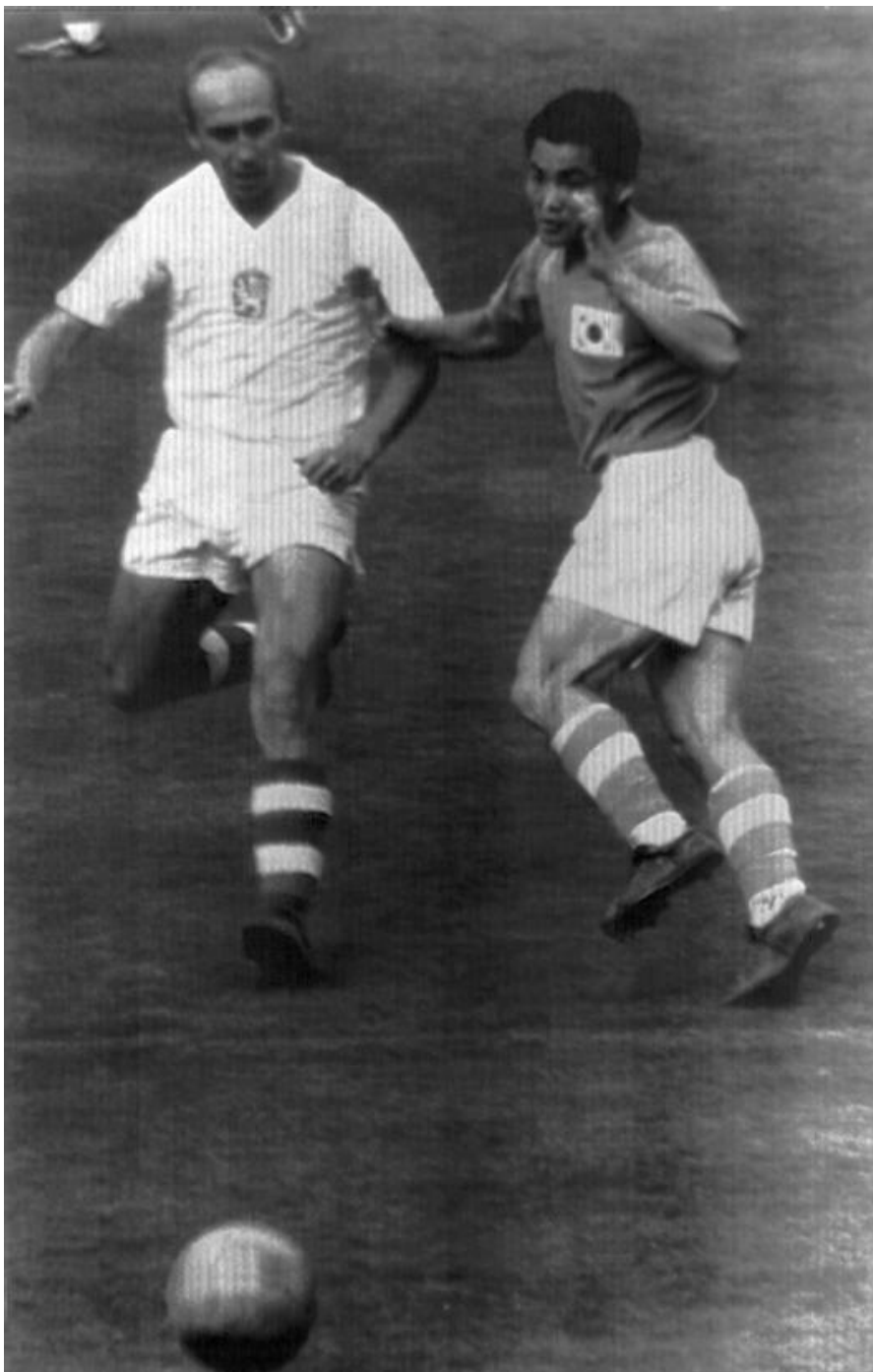
souboj československých a jihokorejských fotbalistů na OH 1964 v Tokyu

Neexistence diplomatických styků, prakticky nulová tradice kontaktů s Korejským poloostrovem, neexistující krajanská komunita a po mnoho let minimální perspektiva vzájemně výhodné ekonomické spolupráce znamenala, že jakékoliv vztahy mezi Korejskou republikou a Československou socialistickou republikou byly po téměř celé období let socialistické vlády v Československu prakticky nemožné.