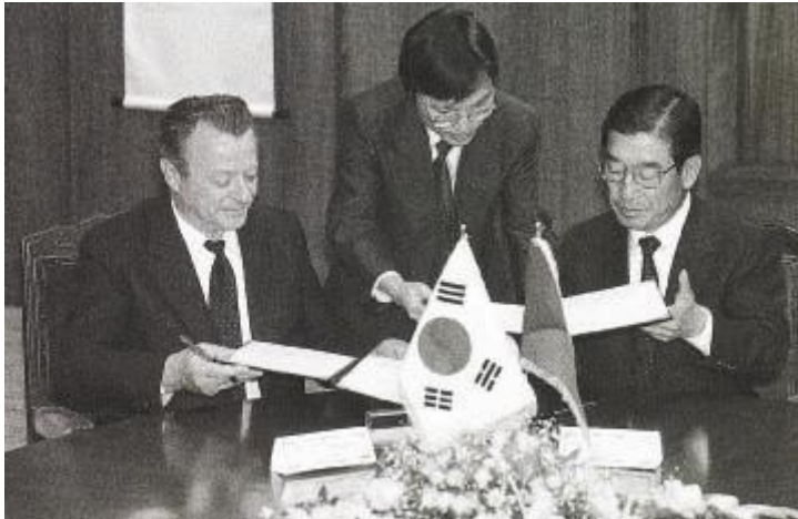
podpis dohody o otevření obchodních zastoupení Československa a KR (Soul, 17. listopadu 1989)

Sportovci, kteří se nakonec za Československo zúčastnili soulské olympiády tak byli vlastně prakticky prvními Čechoslováky, kterým se do Korejské republiky podařilo oficiálně přicestovat. V návaznosti na OH v Soulu tak došlo k prvním nepřímým a pak i přímým kontaktům mezi československými a (jiho)korejskými představiteli a především firmami (prim v tom vedla především firma Daewoo, jejíž automobily, elektronika a nákladní lodě byly dodány do Československa ještě v době socialismu).